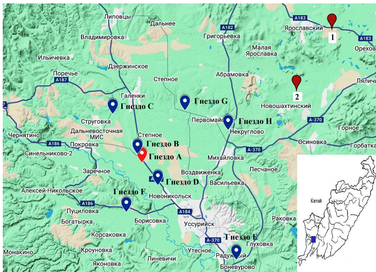
Рис. 1. Расположение гнезд дальневосточного аиста Ciconia boyciana в бассейне р. Раздольная (пояснения в тексте). Цифрами отмечены ближайшие известные гнезда в бассейне оз. Ханка, красным маркером отмечено гнездо, найденное в 2023 г. На врезке показан район исследований.

Однако в 2023 г. жилое гнездо дальневосточного аиста было обнаружено в бассейне р. Раздольная (Рис. 1, 2А). Оно располагалось на опоре ЛЭП в 12 км к северо-западу от г. Уссурийска и в 5 км от русла р. Раздольной. 26 июня 2023 г. в нем находился один оперяющийся птенец (Коробов и др., 2023). Таким образом, впервые было найдено гнездо дальневосточного аиста южнее бассейна оз. Ханка. Ближайшие известные нам гнезда расположены в бассейне озера и находятся в 36 и 50 км (Рис. 1, отмечены цифрами 1 и 2) к северо-востоку от него. Эти гнезда также построены на опорах ЛЭП в бассейне р. Абрамовка (левый приток р. Илистой, Приханкайская низменность, координаты гнезда 1 – N 44°10'26" E 132°17'39", гнезда 2 – N 44°3'22" E 132°11'59"). Однако гнездо 1 не оказалось весной 2024 г. Возможно, оно упало само либо было сброшено электриками. Гнездо 2 также, по-видимому, нежилое. При осмотре 4 декабря 2024 г. оно было деформировано с одного края и заросло сорной растительностью (наши данные). Благодаря этой находке в 2024 г. мы провели детальное обследование подходящих для гнездования аистов участков бассейна р. Раздольная с целью поиска новых гнезд этого вида в пределах данного речного бассейна.