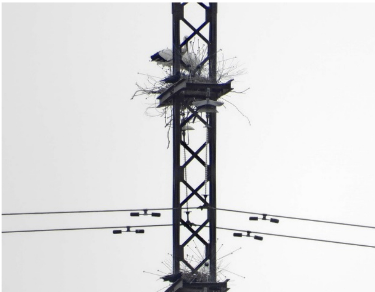
Рис. 4. Гнездо дальневосточного аиста Ciconia boyciana, устроенное на траверсе с устройствами для предотвращения гнездования. Окрестности с. Дмитриевка, Черниговский район, Приморский край, 31.03.2024.

Таким образом, в настоящее время мы наблюдаем процесс расширения ареала дальневосточного аиста на юг, в бассейн р. Раздольная. По всей видимости, это является следствием нескольких причин: увеличения количества выпадающих осадков за последнее десятилетие, небывалого увеличения уровня воды в оз. Ханка, экологической пластичности самих аистов и их последовательной синантропизации, а именно, возросшей толерантности к человеческой деятельности и способности освоить опоры высоковольтных ЛЭП как основу для размещения гнезд. К сожалению, гнездование на ЛЭП приводит к возникновению конфликтных ситуаций с электросетевыми компаниями, которые необходимо решать немедленно с учетом статуса дальневосточного аиста как исчезающего вида, занесенного в Красные книги различного уровня. При наличии доброй воли со стороны энергетиков эти редкие птицы смогут значительно увеличить свою численность и расширить гнездовой ареал, расселившись до низовий р. Раздольной и даже южнее, в Хасанский район, где для этого есть все условия.