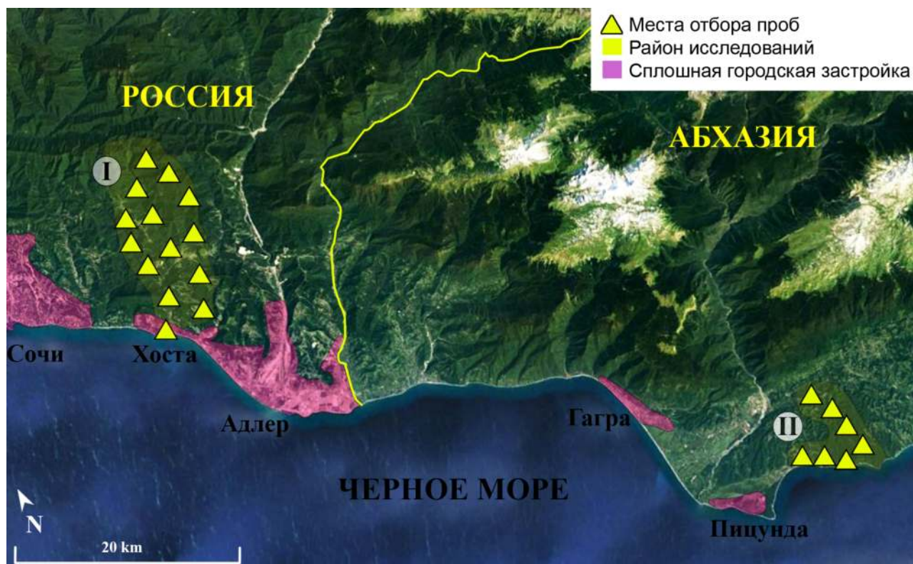
Рис. 1. Карта района исследований. Римскими цифрами обозначены районы исследований: I – бассейн Хосты и Кудепсты; II – бассейн Мюссерской возвышенности.

образный остров, отделенный от южных склонов Бзыбского и Гагринского хребтов Большого Кавказа широкой ложбиной – Калдахварским коридором. Характерен низкогорный холмисто-грядовый рельеф с высотами, не превышающими 250–270 м, сложенный конгломератными породами (Бебия и др., 1987). Здесь полностью отсутствуют карстовые формы рельефа (пещеры, воронки и пр.), родниковые водоемы не имеют прямой связи с подземными водами. Непосредственно с территории Мюссерской возвышенности стигобионтные формы ранее не были известны.